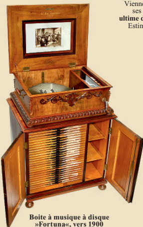
Boîte à musique à disque »Fortuna«, vers 1900

Modèle 104 pour six cylindres de 4 minutes. Excellent état. - Estimation: Euro 5.000 - 8.000 / US$ 7.000 - 11.000