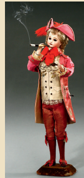
Marquis Fumeur Automate de Léopold Lambert, vers 1885

Tête Jumeau. Excellent état de fonctionnement. 61 cm de haut! - Estimation: Euro 5.000 - 8.000 / US$ 7.000 - 11.000