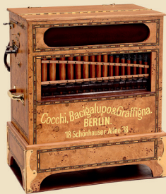
Orgue de barbarie Allemand »Bacigalupo, Berlins«, vers 1910

Avec un joli meuble de stockage de disques et 34 disques de 47,5 cm. Estimation: Euro 2.500 - 4.000 / US$ 3.500 - 5.500