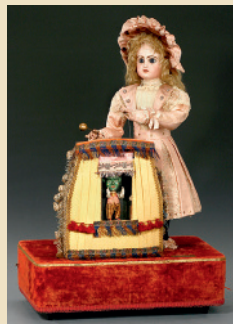
Automate Musical » Théâtre Magique « de Louis Renou, Paris, vers 1890

Machine à sous!! Le rare modèle de 71 cm. Avec une tête Jumeau de taille 7. - Estimation: Euro 15.000 - 20.000 / US$ 21.000 - 27.000