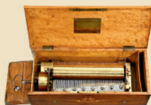
Boîte à Musique ancienne Part-Overture à Clé par Lecoultré, vers 1835-40

Cylindre à 10 jeux. - Excellent état en condition d'origine. Estimation: Euro 8.000 - 12.000 / US$ 11.000 - 16.000