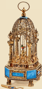
Unique Cage à Oiseau chantant

Avec cylindre à picots pour 8 airs. Grande musicalité - Estimation: Euro 3.500 - 5.000 / US$ 4.700 - 6.700