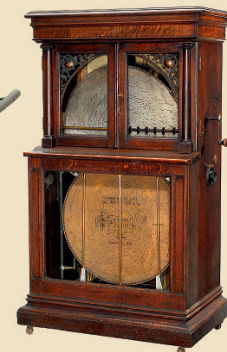
Boîte à Musique à changeur de disque automatique »Regina Style 33 « pour 12 disques.

Orgue à rouleau de papier de 38 notes sur son chariot d'origine. Avec 12 rouleaux. - Etat de fonctionnement excellent. - Estimation: Euro 6.000 - 9.000 / US$ 8.000 - 12.000