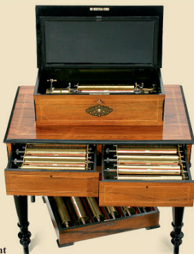
Boîte à Musique à Cylindres Interchangeables par Jean Billon-Haller, vers 1890

En vermeil. Dans le style de Fabergé avec son email translucide typique. Chef d'œuvre de l'orfèvre ongrois (Budapest) qui créa également les joyaux de la couronne de Hambourg-Vienne. - L'oiseau bouge son corps, ses ailes et son bec. - La pièce ultime de collection ou d'exposition. - Estimation: Euro 7.000 - 10.000 / US$ 9.000 - 13.000