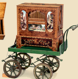
Grand orgue à trompettes sur chariot

Une impressionnante boîte à musique. - Estimation: Euro 3.500 - 4.500 / US$ 4.800 - 6.300