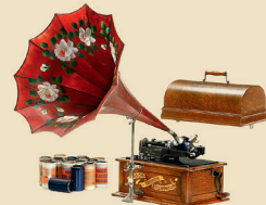
Phonographe »Edison Triumph Mod. A «, 1901

Parfait état de marche. - Estimation: Euro 700 - 1.200 / US$ 1.000 - 1.700