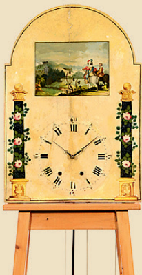
Horloge à flûtes de la Forêt Noire, vers 1880

Parfait état de marche. - Estimation: Euro 700 - 1.200 / US$ 1.000 - 1.700