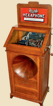
»Regina Hexaphone« Phonographe à changeur, payant, vers 1915

Avec 15 disques de 50 cm. - Joue parfaitement! - Estimation: Euro 5.000 - 6.000 / US$ 7.000 - 8.500