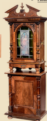
Boîte à Musique à disques »Polyphon N° 104 «, vers 1900

Orgue de barbarie converti pour jouer des rouleaux (type 111). Avec 14 rouleaux. Dimension: 110 x 70 x 148 cm. Excellent état de fonctionnement. - Estimation: Euro 9.000 - 15.000 / US$ 12.500 - 20.000