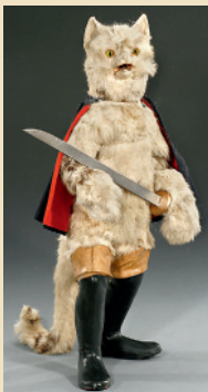
Automate rare »Le Chat Botté« Nodder, vers 1900

Hauteur: 41 cm. - Estimation: Euro 5.000 - 8.000 / US$ 7.000 - 11.000