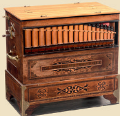
Orgue de barbarie de Bohême par »Franz Bergmann, Reichstadt«, vers 1910

Cylindre à 8 jeux. - Très bon jeu. - Estimation: Euro 9.000 - 13.000 / US$ 12.000 - 18.000