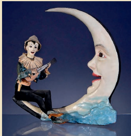
«Aubade à la Lune» Poupée Automate Musical de Gustave Vichy, vers 1890 Estimation: 18.000–20.000€