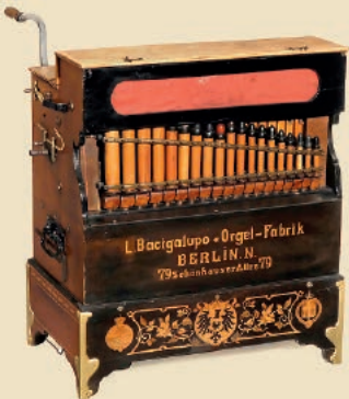
Orgue de Barbarie Bacigalupo Estimation: 8.000–10.000€