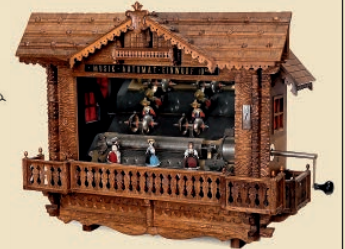
Automate Musical de Gare de Mermod Frères, vers 1900 Estimation: 17.000–22.000€