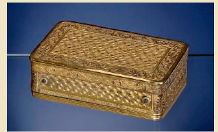
Boîte à Bijoux en vermeil à mouvement musical de F. Nicole, um 1820 De la collection de Luuk Goldhoorn Estimation: 2.500–3.500€