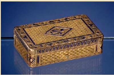
Tabatière en or avec mouvement musical de Piquet et Capt, vers 1810 De la collection de Luuk Goldhoorn Estimation: 6.000–8.000€