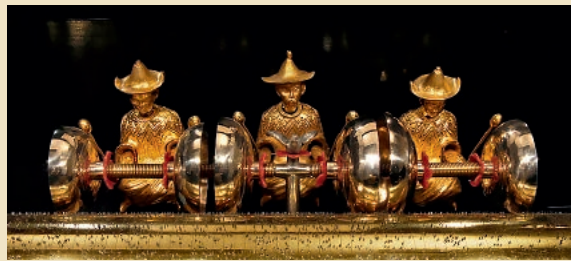
Boîte à Musique avec clochettes de Nicole Frères, vers 1885 Estimation: 7.000–9.000€