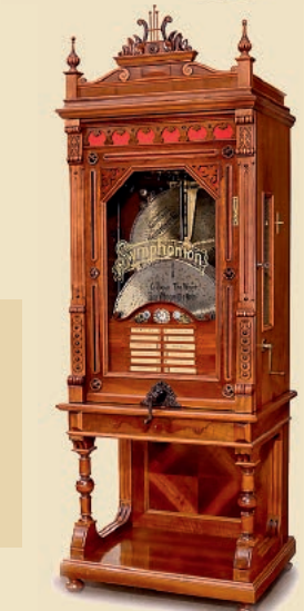
Symphonion à changeur de disque automatique «Non Plus Ultra», vers 1900 Estimation: 55.000–80.000€