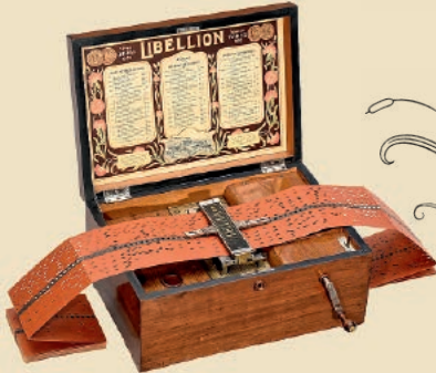
Boîte à Musique Libellion avec cartons, vers 1900 Estimation: 7.000–9.000€