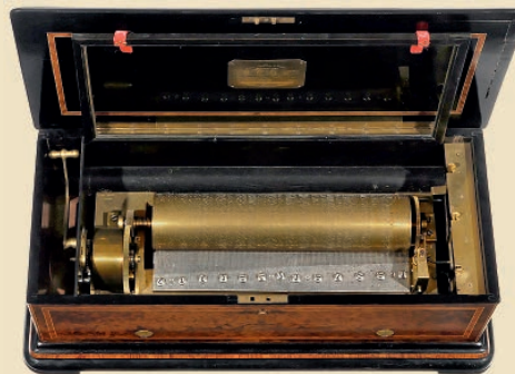
Grande Boîte à Musique avec Variation de Nicole Frères, vers 1865 Estimation: 12.000–18.000€