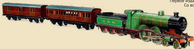
Паровой локомотив фирмы «Gebr. Bing» (стандарт I), ок. 1925

С базой и двумя вагонами (№ 17.894/1 и 17.794/1). Дистрибьютор в Англии «Bassett-Lowke». Длина: 231,2 дюйма. Эстимейт: € 4.000–6.000 / $ 6.000–8.000