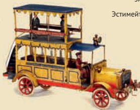
Двухэтажный автобус «Berliet Parisian», Фирма «Pinard», Париж, ок. 1905

Большой раритет! Эстимейт: € 6.000–8.000 / $ 8.000–11.000