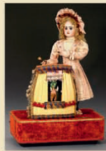
Музыкальный автомат «Волшебный театр» работы Луи Рену, Париж, ок. 1890

Головка из бисвитного фарфора, фирма «Jumeau». Идеальное рабочее состояние. Высота 24 дюйма. Эстимейт: € 5.000–8.000 / $ 7.000–11.000