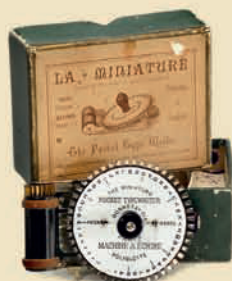
Миниатюрная печатная машинка, 1897 Печатная машинка «Polyglotte» с английской раскладкой. Оригинальная упаковка. Большая редкость! Эстимейт: € 4.000–5.000 / $ 6.000–7.000

Первый в мире двигатель внутреннего сгорания Николауса Августа Отто, изготовленный в Кёльне. Мощность: 1 л.с., 250 об/мин. Топливо: бензин. Вес 490 кг. Размер 69x24x58 дюймов. В отличном рабочем состоянии! Эстимейт: € 20.000–30.000 / $ 25.000–40.000