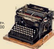
Печатная машинка «Olivetti M1», 1911

Размер 550x550x480 мм. С оригинальной подставкой и тремя лампами. Превосходное состояние. Эстимейт: € 9.000–11.000 / $ 12.000–15.000