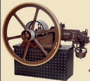
Оригинальный четырёхтактный двигатель Отто, 1895

Первый в мире двигатель внутреннего сгорания Николауса Августа Отто, изготовленный в Кёльне. Мощность: 1 л.с., 250 об/мин. Топливо: бензин. Вес 490 кг. Размер 69x24x58 дюймов. В отличном рабочем состоянии! Эстимейт: € 20.000–30.000 / $ 25.000–40.000