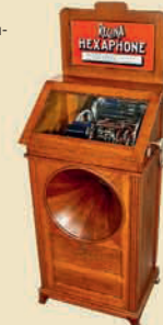
Монетный проигрыватель-автомат «Regina Hexaphone», ок. 1915

Монетный! Редкая модель высотой 26 дюймов. Кукла фирмы «Jumeau» с головкой из бисвитного фарфора. Эстимейт: € 15.000–20.000 / $ 21.000–27.000