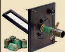
Старинный световой микроскоп, 1750

Марка «Abraham, Optician, Bath». Диаметр 7 дюймов. Прекрасное состояние. Эстимейт: € 2.500–3.500 / $ 3.500–5.000