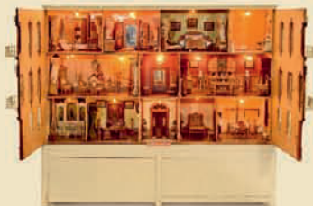
Уникальный кукольный дом «Palazzo», Картахена, Испания, 1903

Оловянная игрушка. Единственный известный экземпляр с двумя лошадками! Большая редкость! Эстимейт: € 12.000–18.000 / $ 16.000–25.000