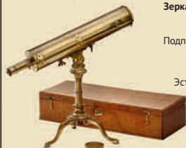
Зеркальный телескоп мастера Джорджа Стерропа, Лондон, 1760

Предположительно работы Джона Каффа, Лондон. Подставка 9x10 дюймов. В хорошем первоначальном состоянии! Эстимейт: € 5.000–8.000 / $ 7.000–11.000