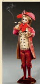
Кукла-автомат «Маркиз-курилки» работы Леопольда Ламбера, ок. 1885

Большая редкость! В мире существует лишь несколько экземпляров! Эстимейт: € 5.000–8.000 / $ 7.000–11.000