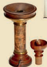
Старинный телефон «сигнал-свиссон» (I), 1878

Большой раритет! Эстимейт: € 6.000–8.000 / $ 8.000–11.000