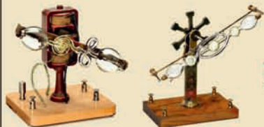
Гейслеровы трубки с моторами, 1910 Модели для демонстрации физических опытов. Эстимейт: € 300–500 / $ 400–700 за каждую

G. De Laresse ad vivum delineatis, Amsterdam, 1685. Первое издание уникального большеформатного анатомического атласа Говарда Бидлоу. Со всеми гравюрами и 105 оригинальными таблицами размером 35x56 см. Эстимейт: € 10.000–20.000 / $ 15.000–30.000