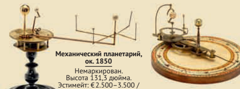
Механический планетарий, ок. 1850

С базой и двумя вагонами (№ 17.894/1 и 17.794/1). Дистрибьютор в Англии «Bassett-Lowke». Длина: 231,2 дюйма. Эстимейт: € 4.000–6.000 / $ 6.000–8.000