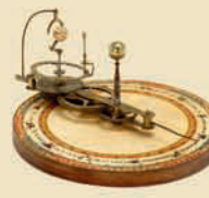
Теллурий (механическая модель Солнечной системы), Англия, ок. 1840

Немаркирован. Высота 131,3 дюйма. Эстимейт: € 2.500–3.500 / $ 3.500–5.000