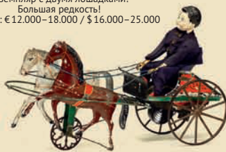
Повозка. Фирма «George Brown», США, ок. 1870

Оловянная игрушка. Длина 18 дюймов! Заводной механизм. Большая редкость! Эстимейт: € 8.000–10.000 / $ 11.000–14.000