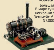
Паровая компаунд-машина «Märklin» (4158/94/11), 1930

Богато украшен миниатюрными картинками, подписанными разными художниками, мебелью в стиле ар-нуво; полы покрыты орнаментальным паркетом. Фантастически большой размер: 180x55x158 см. Исключительно красивая вещь музейного уровня! Великолепный лот! Эстимейт: € 15.000–25.000 / $ 20.000–30.000