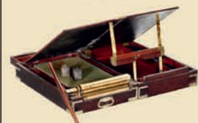
Первая запатентованная копирующая машина Джеймса Уатта, 1780 Эстимейт: € 5.000–8.000 / $ 7.000–11.000

Подпись «Storrer London Fecit». Высота 14,2 дюйма. В хорошем рабочем состоянии. Эстимейт: € 3.500–4.500 / $ 5.000–6.000