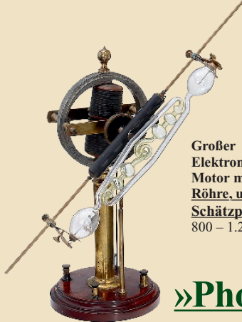
Großer Elektromagnetischer Motor mit Geissler- Röhre, um 1900 Schätzpreis: 800 – 1.200 €