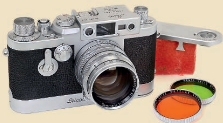
Leica IIIg mit Leicavit und Summarit-Objektiv Schätzpreis: 1.200 – 1.600 €