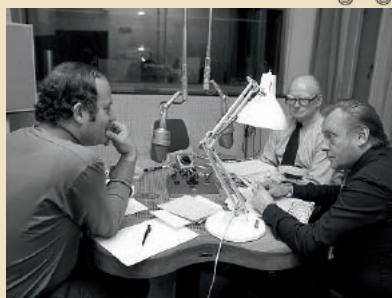
Original NWDR / WDR Rundfunk-Inter- viewtisch, Funkhaus Köln, um 1952 Schätzpreis: 1.000 – 2.000 €