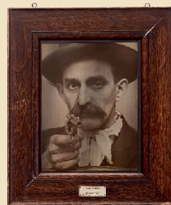
Frederic Ives „Parallax Stereogram“, c. 1902-1905 Schätzpreis: 1.400 – 3.000 €