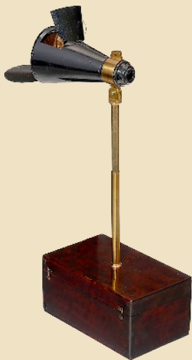
„La Lorgnette Pittoresque“ früher konischer Blechbetrachter, um 1849 Schätzpreis: 1.800 – 3.000 €