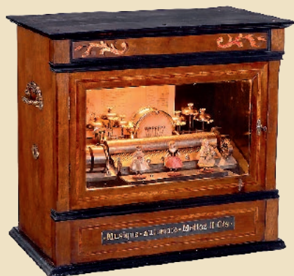
Schweizerischer Bahnhofsautomat mit Figuren, Trommel und Glocken, um 1890 Schätzpreis: 16.000 – 18.000 €