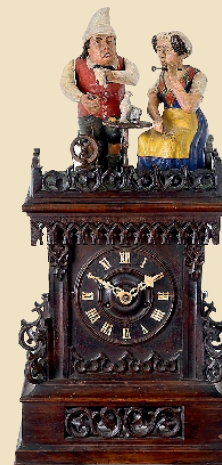
Schwarzwälder Stockuhr mit Figurenautomaten, um 1890 Schätzpreis: 4.000 – 5.000 €