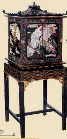
Standgrammophon »Aeolian Vocalion«, um 1920 Mit Chinoiserie-Gehäuse Schätzpreis: € 9.000 – 12.000