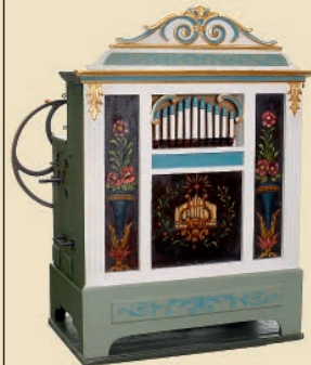
Jahrmarkt-Drehorgel »Wilhelm Bruder Modell 64«, um 1925 Schätzpreis: € 4.000 – 6.000

Weitere Informationen finden Sie auf: www.Breker.com / New Highlights , sowie youtube.com/auctionteambreker