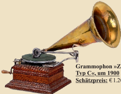
Grammophon »Zonophone Typ C«, um 1900 Schätzpreis: € 1.200 – 1.800