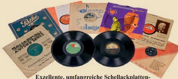
Exzellente, umfangreiche Schellackplatten-Sammlung von Caruso bis Beatles, 1905–1963