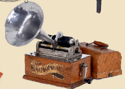
Phonograph »Columbia Graphophone Typ N »Bijou«, ab 1895 Schätzpreis: € 900 – 1.200