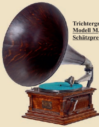
Trichtergrammophon Victor Modell M, um 1905 Schätzpreis: 1.500 – 2.000 €