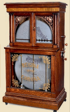
»Regina Modell 34«, um 1903 Großer Plattenwechsel-Automat für 12 Platten Schätzpreis: € 22.000 – 25.000

invaluable The world's premier auctions and galleries