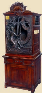
Münz-Phonograph Pathé Concert Modell 5, um 1912 Schätzpreis: € 7.000 – 9.000