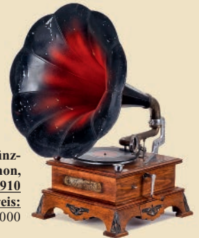
Symphonion Münz- Grammophon, um 1910 Schätzpreis: € 2.000 – 3.000