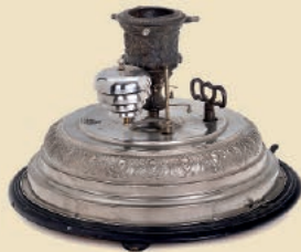
Weihnachtsbaumständer »J. C. Eckhardt« mit Musikwerk und Engels- geläut, um 1905 Schätzpreis: € 700 – 1.000