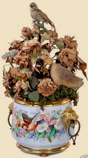
Französischer Singvogel-Automat »Jardinière« von Blaise Bontems, um 1890 Schätzpreis: 8.000 – 12.000 €